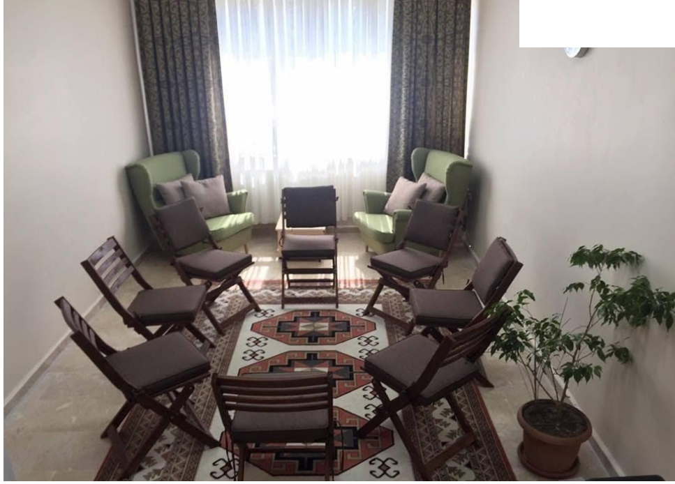
Şekil 1. Stres Yönetimi Araştırma ve Uygulama Birimi Klinik Uygulamalar Ünitesi Fotoğrafları